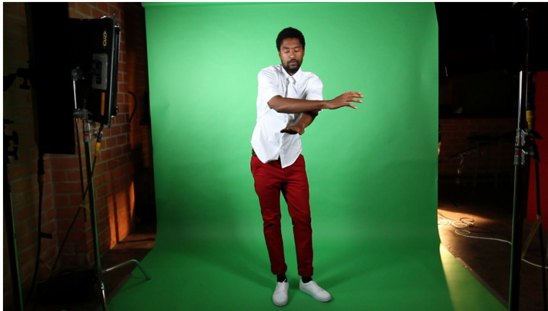
Nástio Mosquito, 'Demo Da Cracia', 2013, video 6:56'

La mostra personale di uno degli artisti emergenti del momento: l'angolano Nástio Mosquito. Il vincitore dell'ultima edizione del Future Generation Art Prize presenta a Venezia presso l'oratorio di San Ludovico la sua produzione video con innesti performativi.