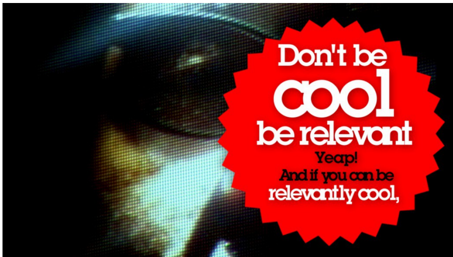
Nástio Mosquito, Nástia's Manifesto , 2008, video, 4:10', Courtesy the artist